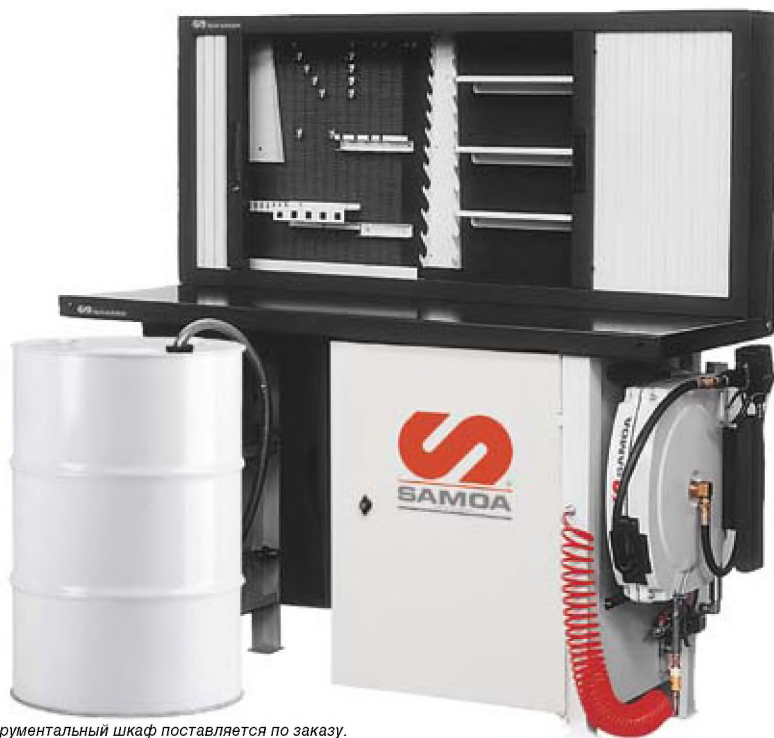
Инструментальный шкаф поставляется по заказу.